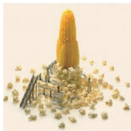
《トウモロコシ燃料ロケット》