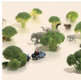
《ブロッコリー1本分のサバンナ》