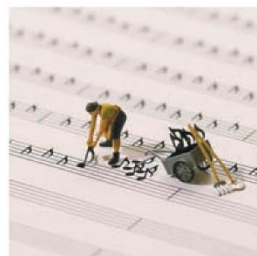
《隠れた名曲を振り起こす》