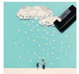
《穴あけパンチの雪。略して「アナ雪」》