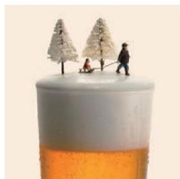
《ビール冷え切ってます》