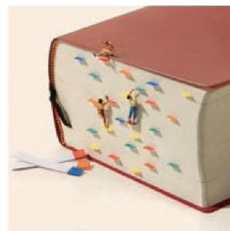
《問題の解き方は人それぞれ》