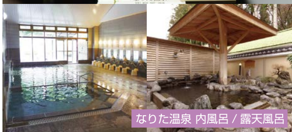
なりた温泉 内風呂 / 露天風呂