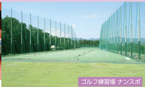
ゴルフ練習場 ナンスポ